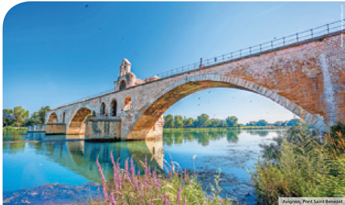
Avignon, Pont Saint Benezet